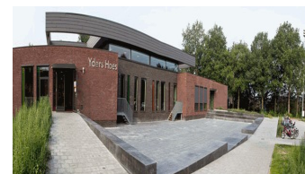
Yders Hoes in Yde