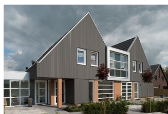
Onder Hypnose in Zuidlaren