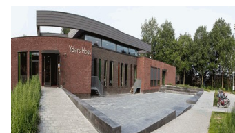
Yders Hoes in Yde