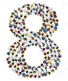
Kleine groepen van 4 - 8 deelnemers

Voor het doorgaan van deze Masterclass ligt het minimum aantal deelnemers op 4, de maximale groepsgrootte is 8 deelnemers.